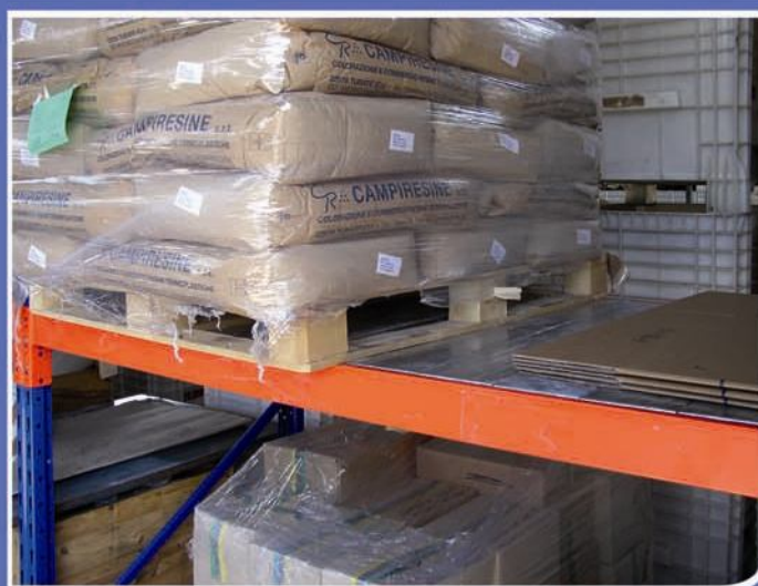
■ Travi SG, sagomata all'interno, per appoggio Tegolini