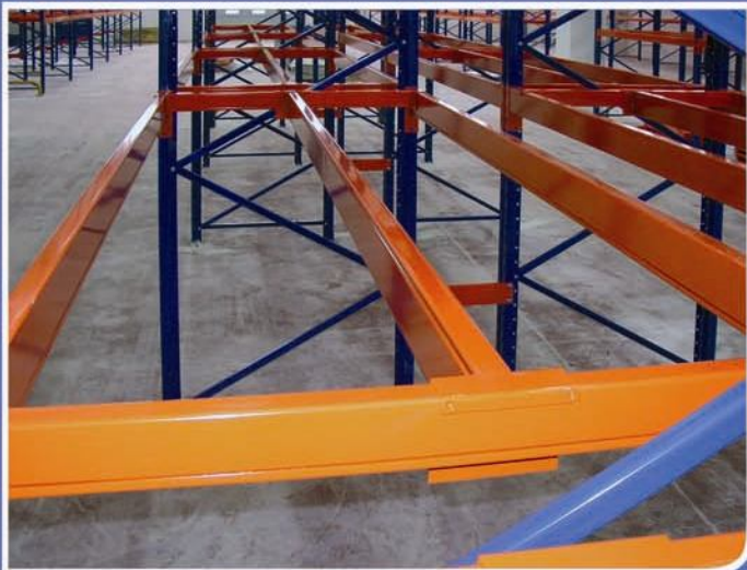
■ Trave centrale singola