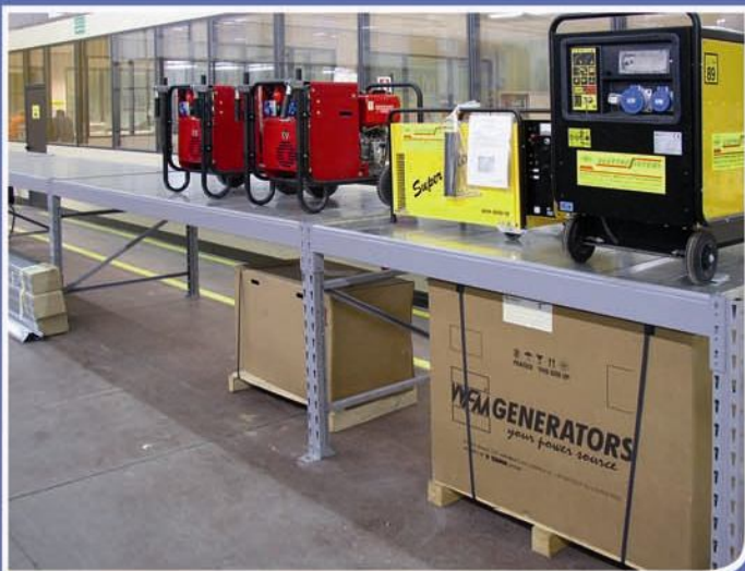
■ Banco esposizione