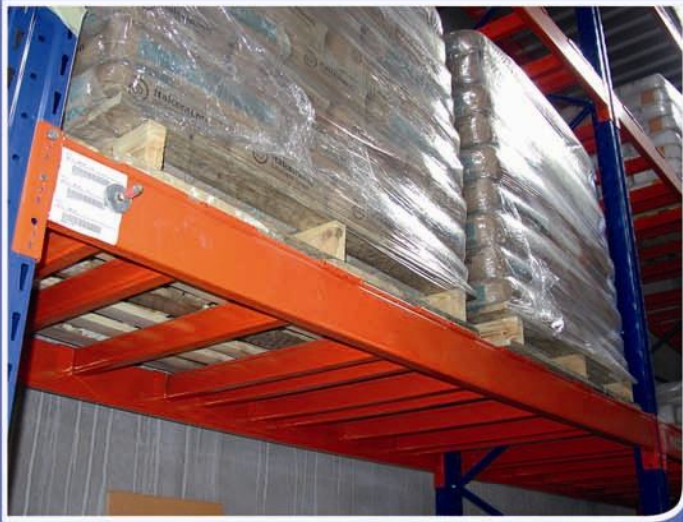
■ Rompitratta tipo A