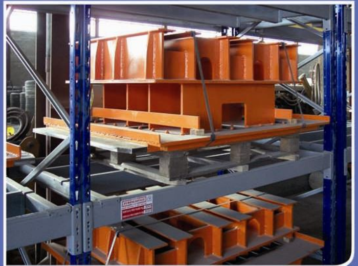
■ Trave centrale doppia