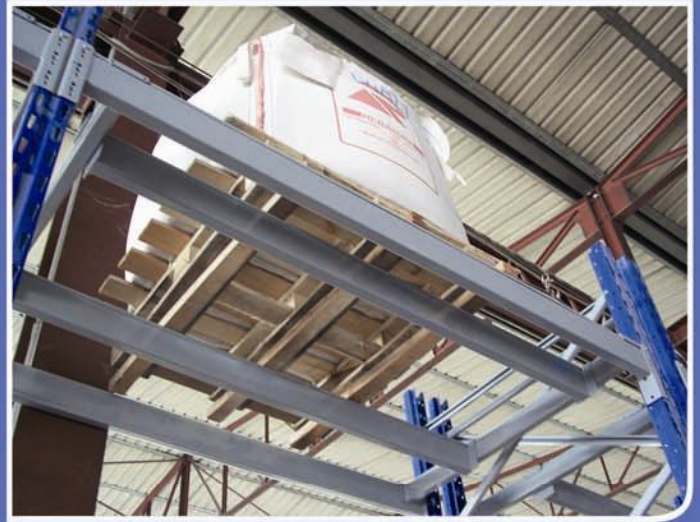
■ Trave centrale doppia