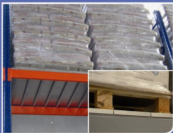
■ Travi BOX in tubolare con appoggio pianetti grandi portate sull'estradosso della trave stessa

Scaffalatura industriale pesante è adatta per lo stivaggio di pallet carichi mediante carrello elevatore. Essa è divisa in tre tipologie (80-100-120) aventi in comune lo stesso modello del montante, ma si differiscono per le dimensioni, spessori e qualità dell'acciaio, a seconda delle portate richieste. La scaffalatura è realizzata da: elementi verticali denominati “ Fiancate ” composte da due montanti collegati tra loro mediante traversini e diagonali bullonati complete di piedini metallici di serie, e da elementi orizzontali denominati “ Travi ” complete di staffe saldate all'estremità, essenziali per l'aggancio ai montanti. Di quest'ultime esistono due profili: travi BOX realizzate da due profili a “C” accoppiati che consentono l'appoggio di pianetti zincati in quanto vengono sovrapposti sull'estradosso della trave stessa e da travi SG in tubolare sagomata, aventi il lato interno ribassato di 25 mm permettendo l'appoggio dei tegolini zincati. Inoltre esiste un'ampia gamma di accessori utili nel personalizzare le strutture in base alle proprie esigenze.